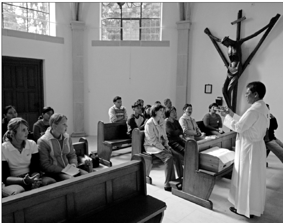
Viele mexikanische Dörfer haben eine eigene kleine Kapelle. Der Pfarrer kommt, wann er kann.

Katholiken angehören, kann nicht direkt diese „Koinonie“ zwischen allen leben und deshalb nicht wirklich „Gemeinde“ sein. Sie kann bestenfalls eine Gemeinschaft von vielen Gemeinden, Gemeinschaften, Basisgruppen, Solidarkreisen oder Christeinsbiotopen sein. Es ist deshalb heutzutage auch notwendig, die historische Fixierung auf das johanneische Pastoralmodell (Hirt und Herde: der Pastor, der alle beim Namen kennt und dem Verlorenen nachgeht! Wie ist das möglich bei 20 000 Christen?) zu überwinden. Wir haben vier Evangelien und es gilt, den Übergang zum paulinischen Evangelisierungsmodell zu gestalten: viele kleine Gemeinden mit unterschiedlichen Diensten und Ämtern (Christus – und nicht der Pfarrer – ist das Haupt und alle sind Glieder).