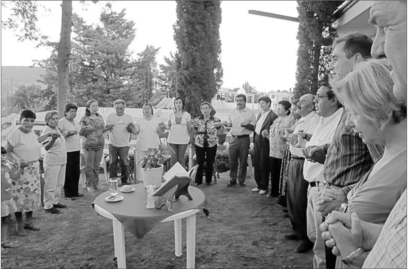
Treffen einer Basisgemeinde in Tula, Mexiko.

Bei Besuchen in Mexiko wird nachgehakt: Jetzt haben wir neue Strukturen – und was dann? Wie macht ihr das konkret? Können wir davon etwas bei uns anwenden? Noch im Mai war eine Delegation von ADVENIAT und Missio (Aachen) in Mexiko. Wir haben Besuche in verschiedenen Pfarreien gemacht und uns intensiv über Grenzen und Möglichkeiten in der pastoralen Praxis