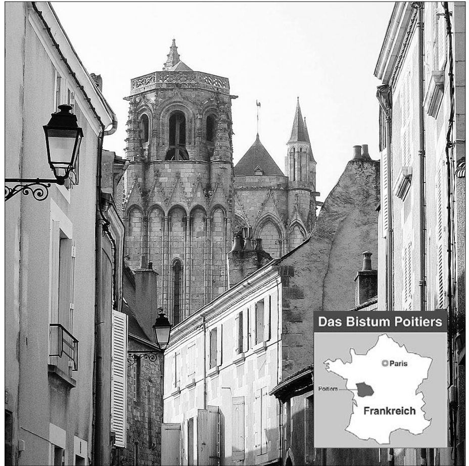
Das Bistum Poitiers